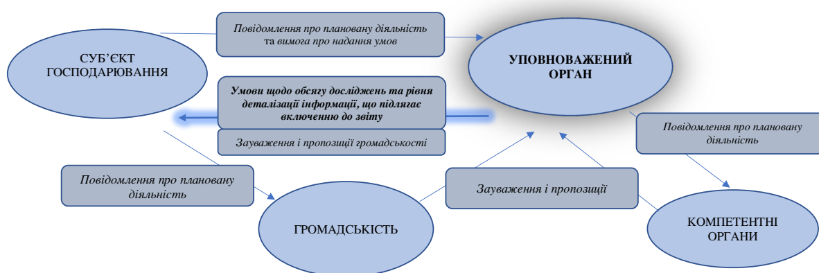
Схема 1. Рух інформації та документів у процедурі скоупінгу між суб'єктами оцінки впливу на довкілля

Крок 1 Суб'єкт господарювання оприлюднює, а також подає уповноваженому органу вимогу про надання умов, а також повідомлення про плановану діяльність, що підлягає оцінці впливу на довкілля, що містить достатньо інформації на основі якої